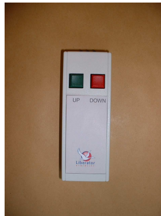
Comando a infrarossi

Ogni telecomando è alimentato da una batteria da 9 volt.